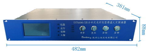
DTS6000-XR 分布式光纤线型感温火灾探测器